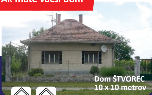
Dom ŠTVOREC 10 x 10 metrov