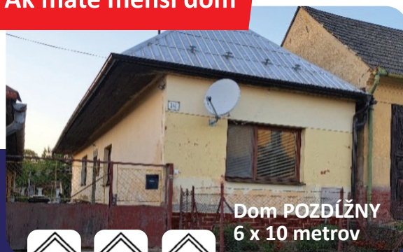
Dom POZDÍŽNY 6 x 10 metrov